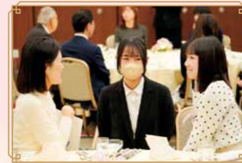
OGと将来について 話をしました