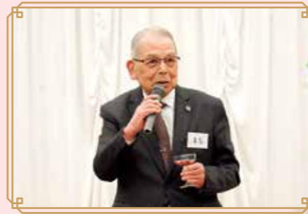
内河監事に 乾杯のご発声をいただきました