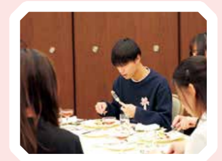
テーブルマナーを学びながら コース料理をいただきました