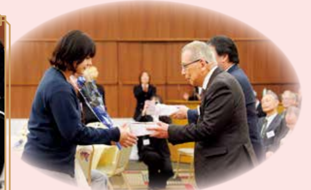
二十歳おめでとう 夢に向かって、いつまでも 応援しているからね!