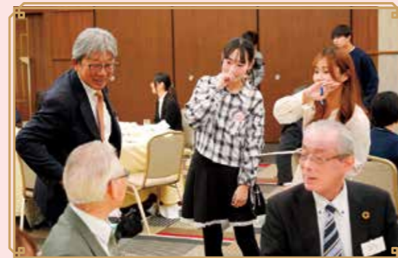
役員の方にご協力いただき OGが用意した問題に挑戦しました